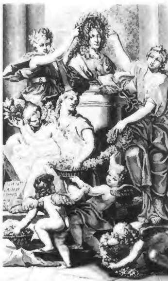
En portada, Luis XIV durante una cacería (detalle de un cuadro de la escuela de Van der Meulen, Museo de Versalles). Izquierda, Luis XIV coronado de laurel en el frontispicio de la primera edición del Dictionnaire , en 1694